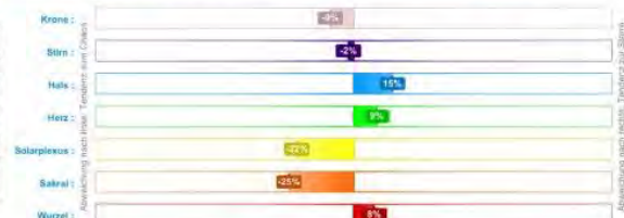
Chakra-Kohärenz (Zeigt an, wie stark das jeweilige Chakra von der ausgeglichenen goldenen Mitte abweicht)

Deutlich sichtbar ist, daß die wenig aktiven bzw. blockierten Chakren sich in kürzester Zeit öffnen und miteinander in Kohärenz gehen.