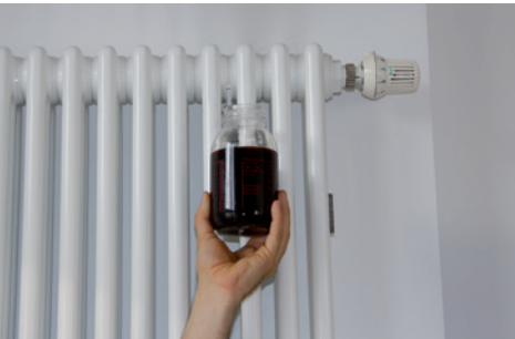
HEIZUNGSWASSER OHNE UMH

Gerne möchten wir über die Erfahrung mit den UMH-Heat-Geräten, welche wir in unsere zwei großen Häuser im Frühjahr 2011 eingebaut haben, berichten. Kürzlich wurden wiederum Wasserproben aus dem Heizungssystem entnommen. Wie schon bei früheren Inspektionen zeigte sich, dass das Heizungswasser völlig klar und schmutzfrei ist.