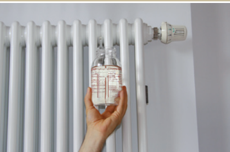
HEIZUNGSWASSER MIT UMH

Diese saubere Wasserqualität wirkt sich erfreulicherweise auch in einer verbesserten Wärmeübertragung im Heizungssystem aus. Das Raumklima hat sich seit dem Einbau der Heat-Geräte ebenso deutlich verbessert und die Bewohner fühlen sich in ihren Wohnbereichen sehr wohl.