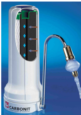
CARBONIT SAN UNO MIT VV5 WIRBLER

Wir verstehen die Wasserbelebung als mögliche Ergänzung zur Filterung: erst die unerwünschten stofflichen Beeinträchtigungen über einen Carbonit®-Filter entnehmen und dann die sog. „feinstofflichen“ Schwingungen behandeln bzw. einbringen. Carbonit® hat eine große Kompetenz in der Herstellung von Filtersystemen - andere Firmen zeichnen sich durch ebenso große Fähigkeiten bei der Fertigung von Geräten zur Wasserbelebung aus. Mit diesen Unternehmen arbeitet Carbonit® in einem Kompetenz-Netzwerk zusammen. Wir empfehlen daher ausgewählte Anbieter von Geräten zur Vitalisierung.“ 13